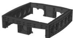
Rám 220 mm Obj. č.: 06 328 0061E 5 × Ø 110 2 × obdélník / 1 × Ø 110 Hmotnost: 21,5 kg