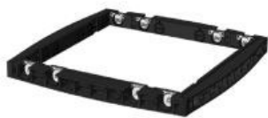
Rám 70 mm Možnost nasazení na stávající vedení Obj. č.: 06 328 0358E 4 × s možností nasazení na stávající vedení / 2 × Ø 50 6 × Ø 50 Hmotnost: 7,8 kg