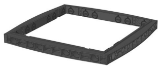
Rám 70 mm Obj. č.: 06 328 0058E 6 × Ø 50 6 × Ø 50 Hmotnost: 7,8 kg

Světlá šířka: 800 × 800 mm Vnější rozměr: 960 × 960 mm