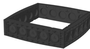
Rám 220 mm Obj. č.: 06 328 0052E 5 × Ø 110 5 × Ø 110 Hmotnost: 25 kg